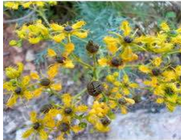
Figure 46: Ruta chalepensis (Daoudi et al., 2016)