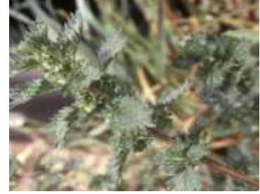
Figure 68: Urtica urens L. (Tela botanica)