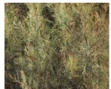
Figure 80: Tamarix articulata (Anwar et al.,2021)