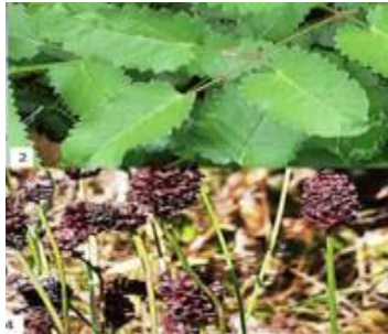
Figure 18: Sanguisorba officinalis L (tocai et al., 2022)