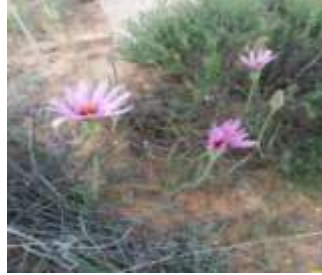
Figure 22: Scorzonera undulata Vahl.( tela botanica)