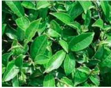
Figure 101: Camellia sinensis (Namita et al. , 2012)