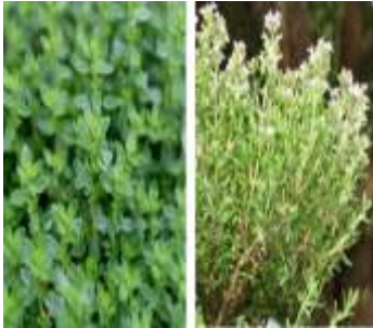
Figure 5 : Thymus vulgaris L(HOSSAÏN et al.,2022)