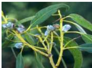
Figure 73: Eucalyptus globulus Labill.(Tela botanica)