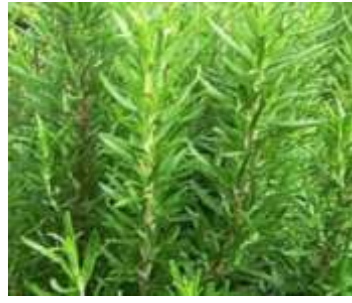
Figure 2: Rosmarinus officinalis L (Farkhondeh et al., 2019)