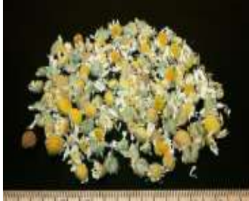
Figure 21: Chamaemelum nobile L.All(Zhao et al.,2014)