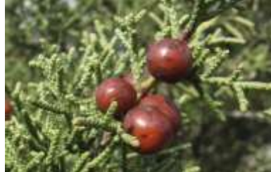
Figure 91: Juniperus phoenicea L.(Nedjimi et al.,2015)