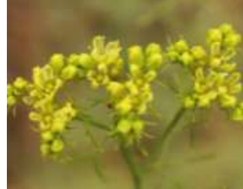
Figure 47: Ruta montana L. (Tela Botanica, 2012)