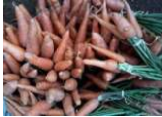
Figure 26: daucus carota L.(Maiga, 2014)