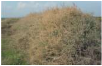
Figure 85: Atriplex halimus L.(BECCARISI et al.,2015)