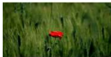
Figure 59: Triticum durum Desf(Tela botanica)