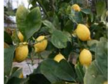
Figure 48: Citrus Limon (Lim et Lim,2012)