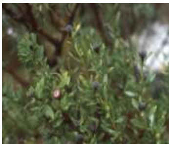
Figure 93: Globularia alypum L. (Tela botanica)