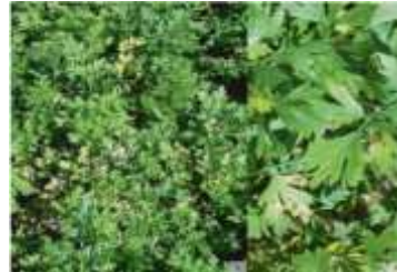
Figure 27: Petroselinum crispum L (Marthe,2020)