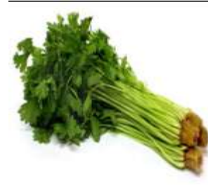
Figure 31: Apium graveolens