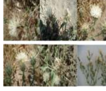
Figure 20: Centaurea microcarpa Batt. (Baatouche et al., 2019)