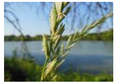
Figure 56: Triticum repens L. (Tela botanica)