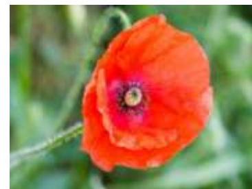
Figure 75: Papaver rhoeas L. (Tela botanica)