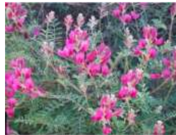
Figure 55: Hedysarum naudinianum Coss. & Durieu. (Goudjil-Benhizia et Khalfallah. 2017).