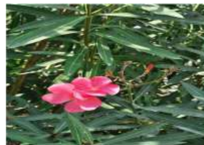
Figure 6: Laurier rose ( Nerium oleander L.) (Pellet et al. , 2015).

Toutes les parties de la plante Nerium oleander sont extrêmement toxiques en cas d'ingestion, car elle contient des glycosides cardiaques. Ces derniers provoquent une toxicité cardiaque en inhibant la pompe \text{Na}^+/\text{K}^+ ATPase présente dans la membrane cytoplasmique des cellules cardiaques. En effet,