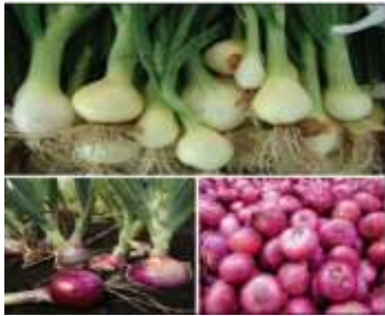
Figure 41: Allium cepa L. (Upadhyay,2016)