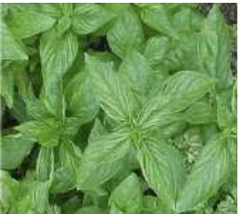
Figure 9: Ocimum basilicum (Li et Chang,2016)