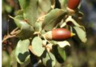
Figure 86: Quercus ilex L.(Villar-Salvador et al.,2013)