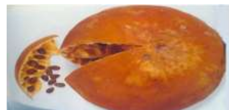
Figure 3: Fruit mûr de C.colocynthis L. (Tela botanica)

Toutes les parties de la plante sont toxiques, notamment les fruits et les graines. Cette plante contient des cucurbitaines et des glycosides, ce qui entraîne une toxicité digestive avec l'apparition d'effets secondaires tels que des crampes abdominales, de la diarrhée, des vomissements, une néphrose, des maux de tête et des coliques ( Rahimi et al., 2012 ; Hammiche et al., 2013 )