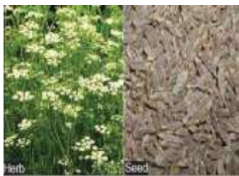
Figure 29: Carum carvi (Johri, 2011)