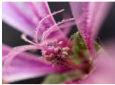
Figure 66: Malva silvestris L. (Tela botanica)