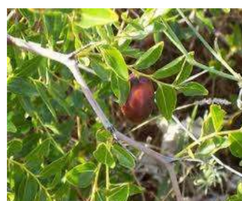
Figure 39: Zizyphus lotus (Ghedira, 2013)