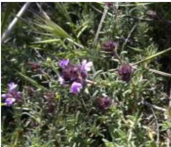
Figure 10: Thymus munbyanus subsp. Coloratus (Bendif et al.,2018)