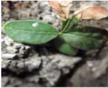
Figure 65: Pistacia atlantica Desf (Tela botanica)