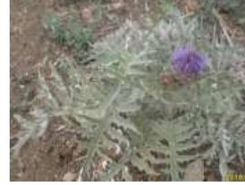
Figure 16: Cynara cardunculus L. (El Harym et Belqat.,2017)