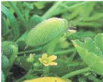
Figure 45: Ecballium elaterium (Salhab, 2013)