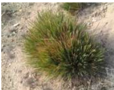
Figure 57: Ampelodesmos mauritanicus (Diss) ( Abdelhak et ramdan, 2017)