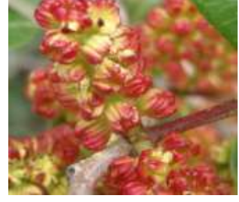
Figure 64: Pistacia lentiscus (Tela botanica)