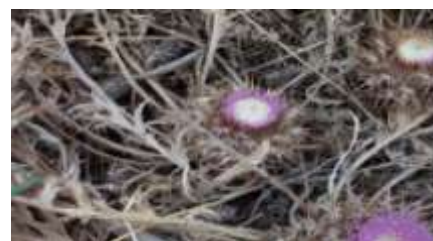
Figure 2: Partie aérienne de Atractylisgummifera L. ( Zaim et al.,2008 )

Toutes les parties de cette plante sont toxiques, mais la racine fraîche est la plus nocive. La toxicité de cette plante est principalement due à deux glycosides diterpénoïdes (l'attractyloside et la carboxy-attractyloside) qui entraînent l'inhibition de la phosphorylation oxydative en bloquant le CYT P450, perturbant ainsi la conversion d'ATP en ADP, ce qui perturbe le système de détoxification. Ces effets sont suivis d'une hépatite sévère et potentiellement mortelle ( Daniele et al., 2005 ; Hammiche et al., 2013 ).