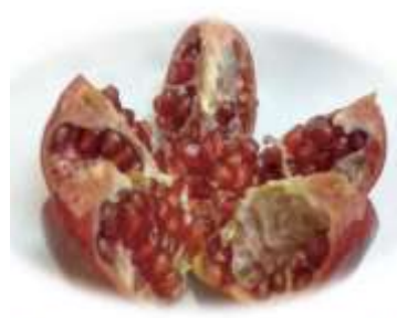
Figure 77: Punica granatum L.(Eghbali et al., 2021)