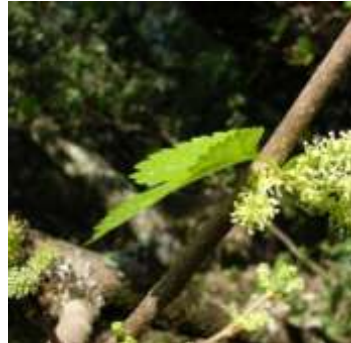
Figure 99: Morus alba L. (Tela botanica)