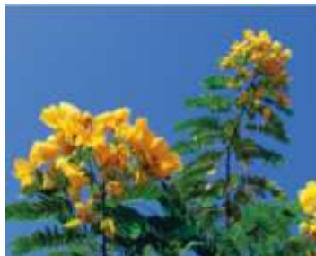
Figure 54: Cassia senna L. (Ulbricht et al., 2011)