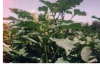
Figure 87: Datura stramonium (Bouzidi et al., 2002)