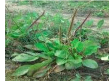
Figure 76: Plantago major L. (Nazarizadeh et al .,2013)