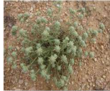
Figure 11: Teucrium polium L (TOUAIBIA,2021)