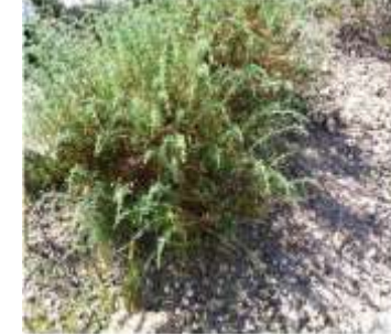
Figure 12: Artemisia herba-alba (Mohamed et al., 2010)