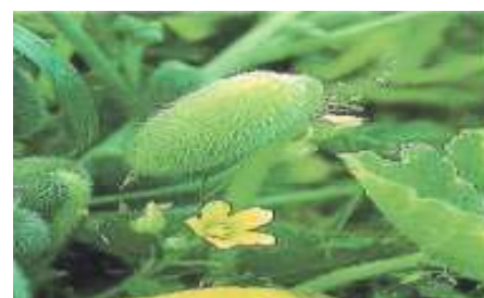
Figure 4: La plante Ecballium elaterium Rich. (Salhab, 2013)

Toutes les parties de la plante sont considérées comme toxiques, en mettant en évidence le fait que le jus de fruit de cette plante est particulièrement toxique lorsqu'il est utilisé de manière concentrée. La principale toxicité de cette plante est