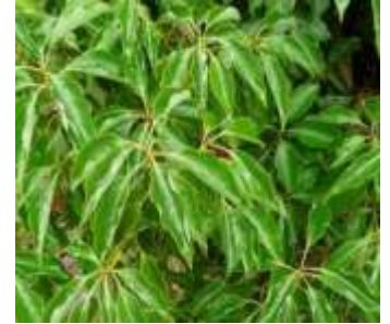
Figure 52: Cinnamomum camphora (Ravelomanantsoa et al.,2023)