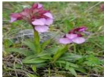
Figure 74: Anacamptis papilionacea L.( Lewis et Kreutz,2013)