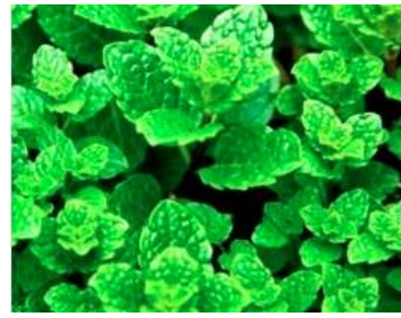
Figure 3: Mentha piperita L.(Fayed, 2019)