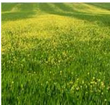
Figure 97: Sinapis arvensis L.(Qasem,2011)