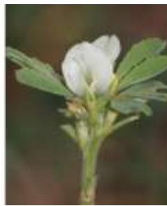
Figure 50: Trigonella foenum-graecum L. (Tela botanica)