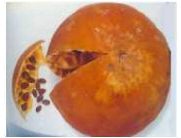
Figure44: Fruit mature de C.colocynthis L.