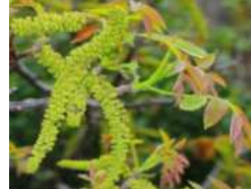
Figure 72: Juglans regia L.(Tela botanica)