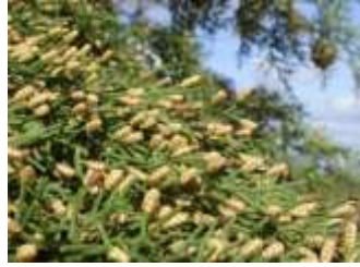
Figure 90: Cupressus sempervirens L. (Tela botanica)