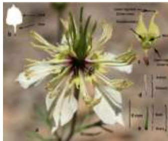
Figure 42 : Nigella arvensis L. (DÖNMEZ et al.,2021)