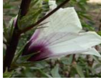
Figure 67: Hibiscus sabdariffa L. ( Tela botanica)