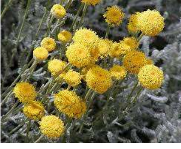
Figure 19: Santolina rosmarinifolia L.(Tela botanica)