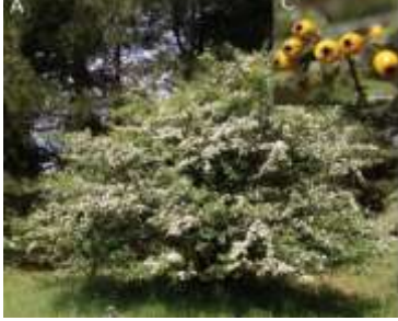
Figure 61: Crataegus azarolus Dif et al., 2015)