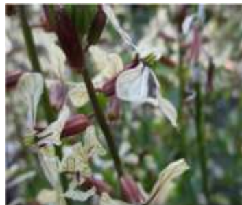
Figure 35: Eruca vesicaria (L.) Cav(Tela botanica)