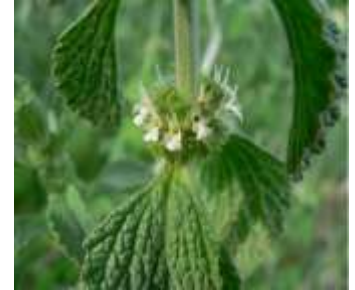
Figure 4: M .Vulgare (Kamel et Maria,2009)