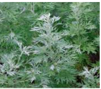
Figure 17: Artemisia absinthium (Batiha et al.,2020)