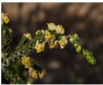
Figure 81: Thymelaea hirsuta Endl(tela botanica)