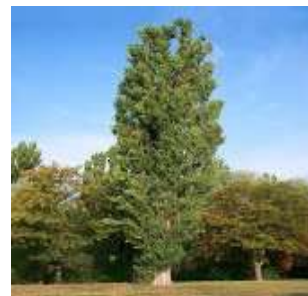
Figure 79: Populus nigra L. (De Rigo et al., 2016)