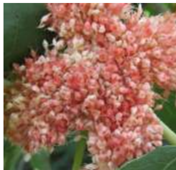
Figure 98: Ficus carica (Tela botanica)