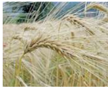
Figure 58: Hordeum vulgare L.(tela botanica)