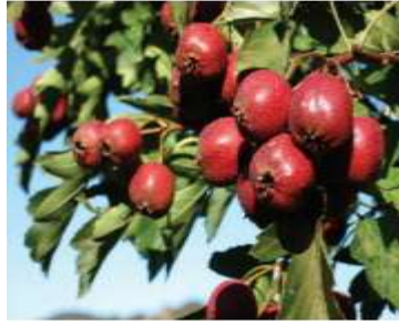
Figure 62: Crataegus oxyacantha L.(Wang et al.,2013)