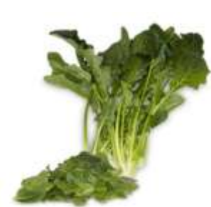
Figure 37: Spinacia oleracea L (Gil et Garrido,2020)