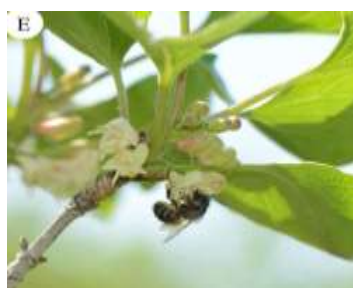
Figure 78: Clematis cirrhosa L.(Wu et al.,2022)