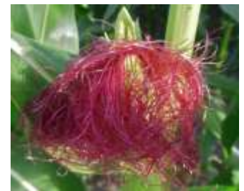
Figure 60: Zea mays L. ( Tela botanica)