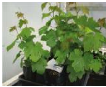
Figure 82: Vitis vinifera L.(Mckenzie et Pathirana,2017)