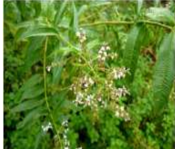
Figure 94: Verbena officinalis (Benzarti et al.,2016)