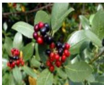
Figure 38: Rhamnus alaternus ( journaux le monde Binette & Jardin )