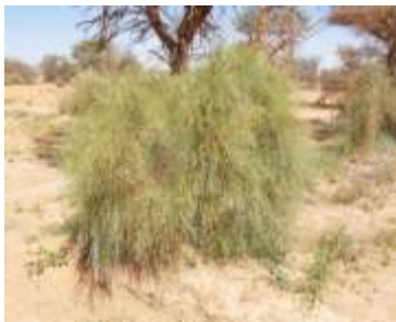
Figure 53: Retama raetam L (tela-botanica)