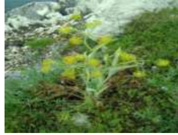
Figure 23: Thapsia garganica L.(Tela Botanica, 2009)