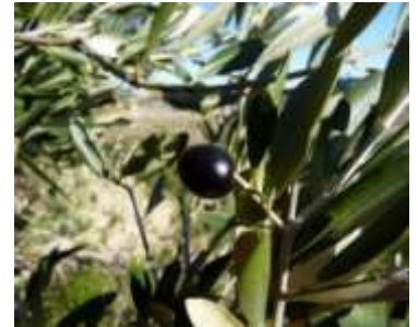
Figure 96: Olea europaea L. ( Tela botanica)