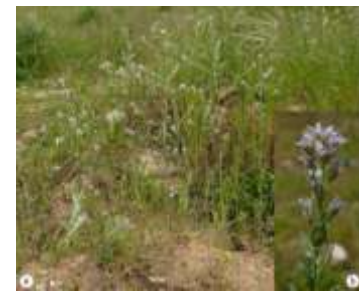
Figure 34: Lepidium sativum L. (Bona,2014)