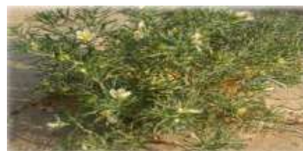
Figure 5: Peganum harmala L. (Eltahir et Dahab, 2019)

Toutes les parties de la plante sont toxiques, en particulier les graines. Cette toxicité est due à la présence d'alcaloïdes tels que l'harmine, l'harmane, la harmaline, la harmol et la harmalol, qui peuvent entraîner une toxicité neurologique et neuromusculaire avec les effets indésirables suivants :