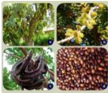
Figure 49: Ceratonia siliqua L