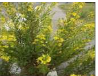
Figure 13: Inula viscosa L.(Prisa,2020)