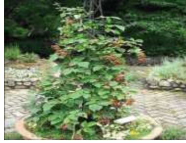
Figure 63: Rubus fruticosus L. (verma et al., 2014)