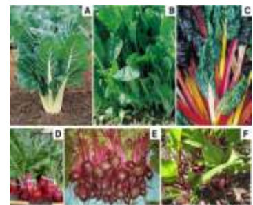
Figure 36: Beta vulgaris L.(Ninfali et Angelino., 2013)