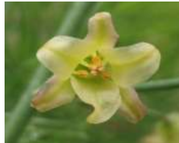
Figure 43: Asparagus officinalis L. (Tela botanica)