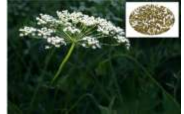
Figure 28: Pimpinella anisum L.(Shojaii et Abdollahi Fard, 2012)