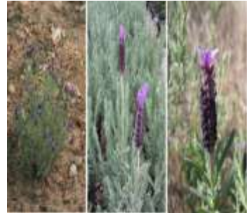
Figure 6: Lavandula staechas L (Ez zoubi et al.,2020)