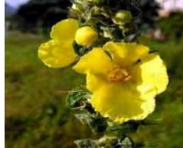
Figure 95: verbascum thapsus L. (Boumaza et Khentoul, 2017)