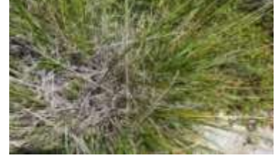
Figure 88: Stipa tenacissima L. (Tela botanica)