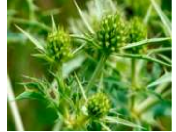
Figure 24: Eryngium campestre L. (Medbouhi et al.,2018)