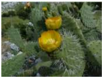
Figure 69: Opuntia ficus indica L. (Tela botanica)