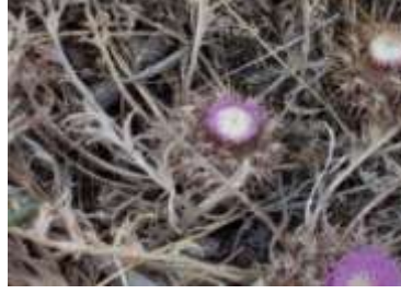
Figure 15: Atractylis gummifera L ( Zaim et al.,2008)