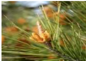
Figure 89: Pinus halepensis L. (Tela botanica)