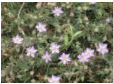
Figure 70: Spergularia rubra L. (Tela botanica)