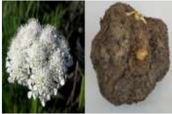
Figure 25: Bunium mauritanicum L. (ADOUI et al.,2022)