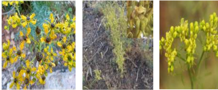
Figure 7 : Les rues (Daoudi et al., 2016 ; Ghedjati, 2023 ; Tela botanica )

Les rues contiennent des coumarines, des alcaloïdes et des flavonoïdes, qui se trouvent dans toutes les parties de la plante. Ces composés possèdent des propriétés toxiques, notamment sur le plan digestif, neurologique, phototoxique, et ils peuvent également agir comme emménagogues et abortifs.