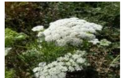
Figure 32: Visnaga daucoides Gaertn. = Ammi visnaga Lamk. (Tela botanica)