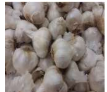
Figure 40: Allium sativum L(Akbar et Akbar,2020)