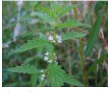
Figure 8: Lycopus europaeus L (Tela botanica)