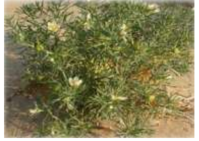
Figure 84: P. harmala (Eltahir et Dahab,2019)