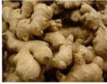
Figure 83: Zingiber officinale Roscoe( Ahmed et al.,2011)