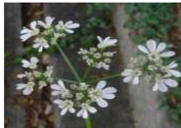
Figure 30: Coriandrum sativum L. (Tela botanica)