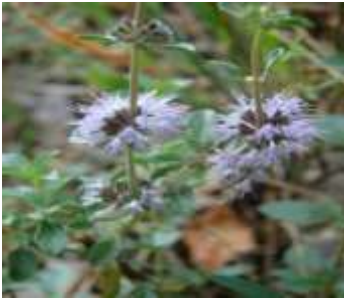
Figure 1: Mentha pulegium (Tela Botanica, 2013)