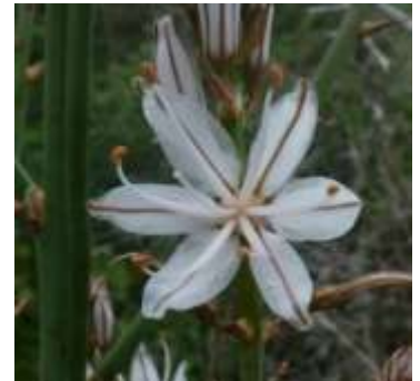
Figure 100: Asphodelus ramosus L.