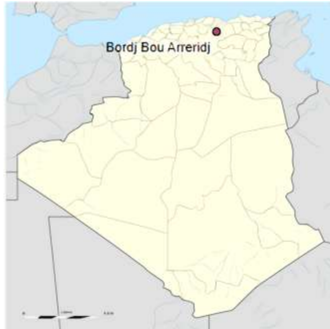
Figure 01: Carte géographique de la zone d'étude : situation de la wilaya de Bordj BouArreridj (Gifex).