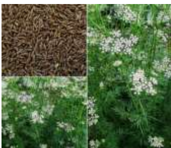
Figure 33 : Cuminum cyminum L(Barala et al., 2023)