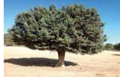
Figure 92: Juniperus oxycedrus L. (Ouaar et al., 2021)