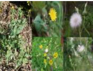
Figure 14: Sonchus oleraceus L.(Peerzada,2019)