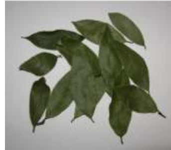
Figure 51: Laurus nobilis (Marques et al.,2016)