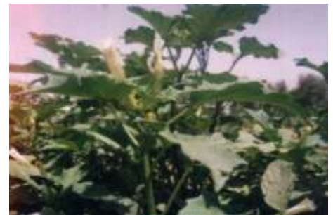
Figure 8: La plante du Datura stramonium L. (Bouzidi et al., 2002).

Toutes les parties de la plante sont toxiques, en particulier les graines. Cette espèce est responsable du syndrome anticholinergique ou atropinique en raison de la présence de substances toxiques, à savoir l'atropine et la scopolamine. Ce syndrome se manifeste par l'apparition de troubles secondaires tels que la mydriase bilatérale et les troubles de l'accommodation, la tachycardie, la vasodilatation, etc.