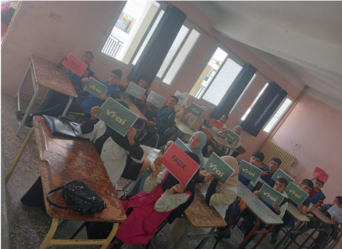
Annexe 02 : Jeu ludique le lièvre et la tortue