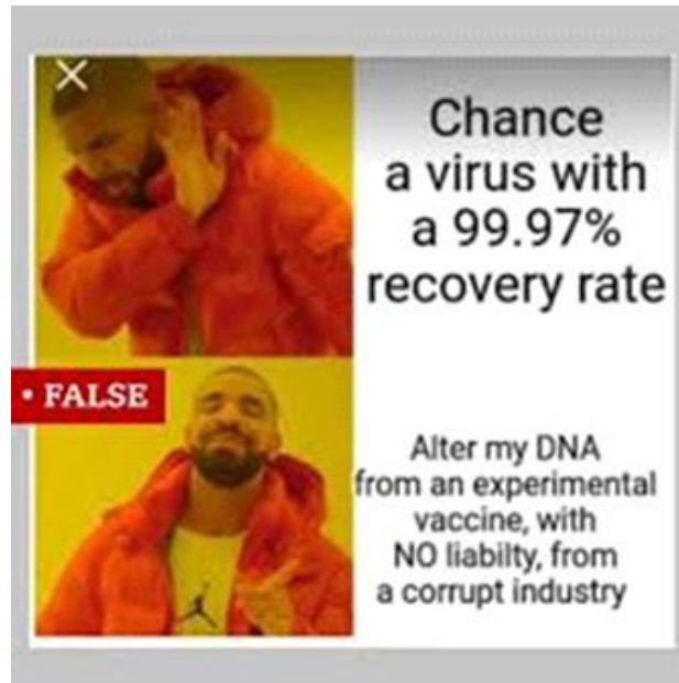
Figure 1. Exemples de mèmes Internet