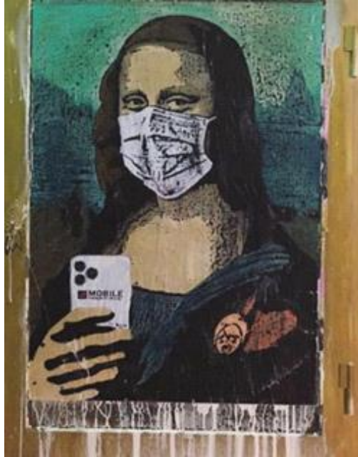
Figure 08. Mobile World Virus