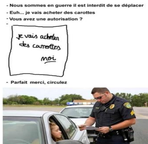
Figure 03. Déclarations sur l'honneur pour les déplacements autorisés