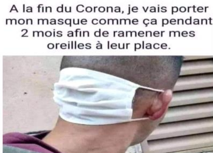
Figure 09. La forme des oreilles après deux mois du port de masque

personne exerçant le télétravail durant le confinement. L'élément humoristique réside dans le fait que le travail à distance s'effectue souvent par voie audio et vidéo. Ainsi, lorsque la personne est amenée à transmettre un contenu audio, elle accorde moins d'importance à son apparence physique, négligeant la coiffure, la tenue vestimentaire, le maquillage pour les femmes, ainsi que le choix d'un cadre chic ou agréable dans son domicile. En revanche, lorsque la communication à distance s'effectue par le biais de vidéos, l'intervenant accorde une attention considérable non seulement au message véhiculé, mais également à sa posture corporelle, son habillement, sa coiffure, au choix d'un environnement approprié, etc. On peut affirmer qu'au cours de la période de confinement, le mode de travail, qu'il soit en présentiel ou à distance, a subi d'importantes modifications dans les habitudes, les comportements et les mentalités, entraînant parfois des aspects humoristiques, ironiques, voire moqueurs, comme en témoigne l'image.