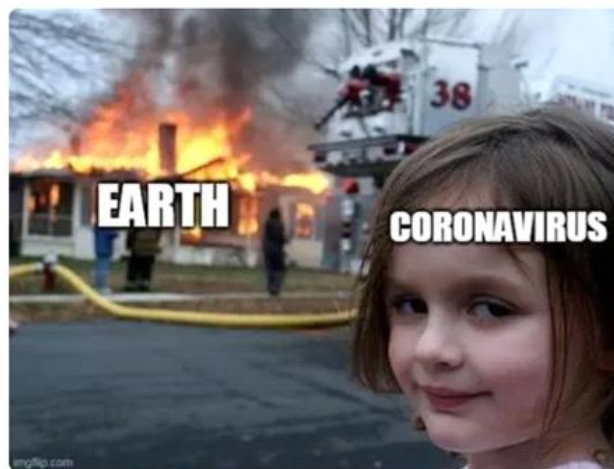
Figure 07. Disaster Girl

Le mème qui suit met en lumière une partie des occurrences survenues pendant la pandémie de coronavirus. Les États se sont retrouvés dépourvus de stocks suffisants de masques pour répondre à l'épidémie. En raison de l'ampleur de la crise sanitaire, le monde a connu une pénurie d'équipements de protection individuelle, notamment de masques, tandis que des milliers de personnes étaient infectées. Par conséquent, cette pandémie a engendré un chaos au sein des États, provoquant des perturbations à grande échelle. Des milliers de personnes ont été contaminées, certains ont souffert gravement et d'autres avaient perdu la vie. Cela a entraîné un mécontentement au sein de la population mondiale.