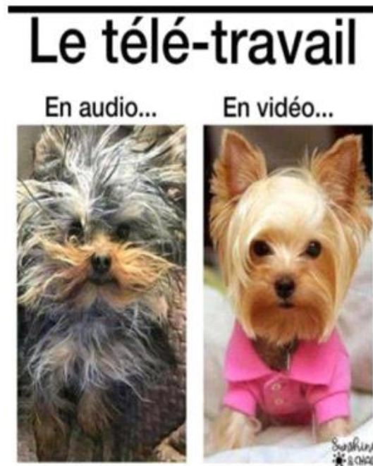
Figure 08. Le télé-travail durant la pandémie Covid-19

L'image dépeint un personnage aux yeux écarquillés, semblablement indifférent à la catastrophe, et a acquis une grande popularité sur les réseaux sociaux, en particulier sur Reddit, pour ironiser sur des sujets d'actualité sombres. Ce dessin est utilisé par les internautes depuis plusieurs années pour illustrer un sentiment de résignation ou un déni face à des réalités troublantes. Cette œuvre emblématique d'un dessinateur américain est souvent reprise sous la forme d'un extrait isolant ses deux premières vignettes, agissant comme un mème de réaction adaptable à diverses situations. Bien que de nombreuses variations existent, sa recontextualisation se caractérise principalement par une réutilisation de l'image. Son utilisation comme critique d'une situation se manifeste surtout à travers une légende ou parfois par une simple citation dans le cadre d'une conversation.