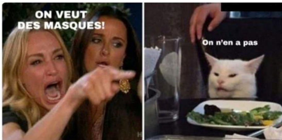
Figure 06. Woman Yelling at a Cat

Il convient également de mentionner qu'il s'agit d'une coopération entre un artiste d'origine indienne et les forces policières, avec une attention particulière portée à ce casque évoquant un virus. L'agent de police attire l'attention non pas à l'aide d'une représentation au microscope, mais par le biais de la personnification du virus. Une autre couche d'ambiguïté se révèle, puisque derrière l'avertissement du policier se trouvent la foule, le contact et un regroupement d'individus, ce qui entraîne nécessairement un risque de contagion. Par conséquent, cette image parvient à éveiller à la fois le rire et l'inquiétude. Ce paradoxe pourrait bien être l'essence même de ces photographies : l'ambiguïté, qui nous entraîne dans un balancement entre des extrêmes opposés.