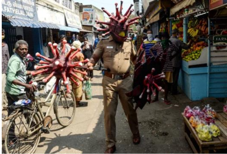
Figure 05. Uniforme de police et tête de virus