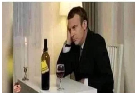
Figure 04. Quand le nouveau variant a presque le même nom que moi