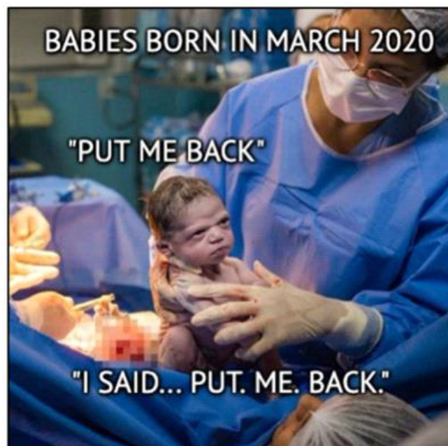
Figure 10. Babies Born In March 2020

Le signe plastique présent dans cette icône représente un élément clé de l'humour, tout comme la formule « afin de ramener mes oreilles à leur place », qui provoque le rire chez le lecteur. Effectivement, suite au port prolongé du masque pour minimiser le risque de contamination lié à la COVID-19, les oreilles ont modifié leur apparence, se penchant vers l'arrière à cause de l'élasticité du masque. L'énonciateur semble proposer une méthode pour réaligner ses oreilles dans leur position naturelle. Il affirme qu'il portera son masque à l'envers afin que ses oreilles soient redressées et retrouvent leur position originale. Cette idée, d'une absurdité frappante, génère de l'humour en renforçant le sens humoristique transmis initialement par le signe plastique.