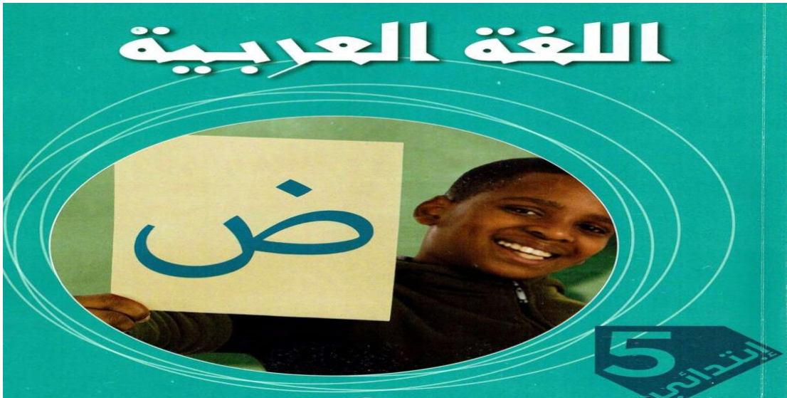
كتاب اللغة العربية الجيل الثاني