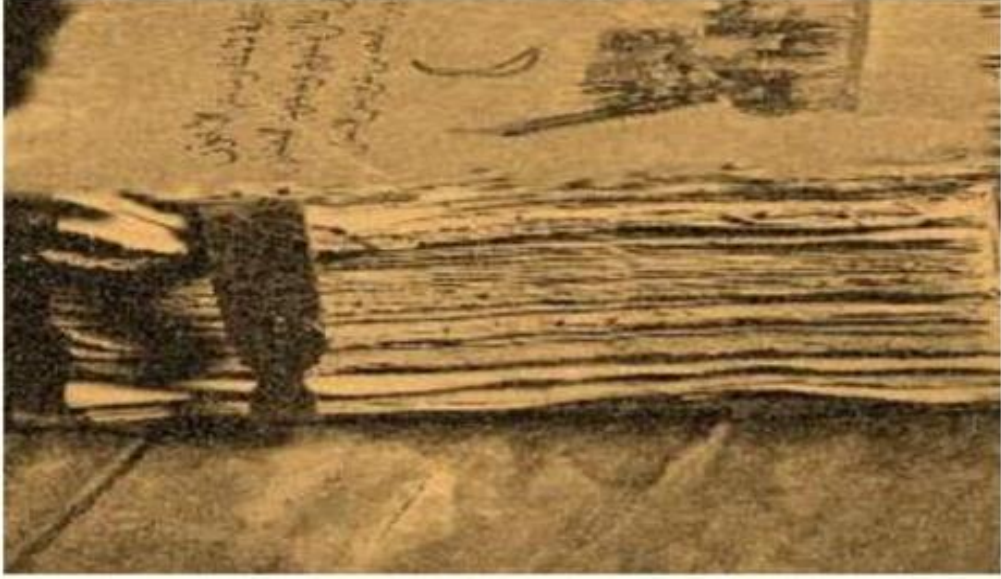
(صورة الصفحة الأولى من المخطوط) من الرواية ص 11.

والصورة الثالثة هي للصفحة الأولى من المخطوط.