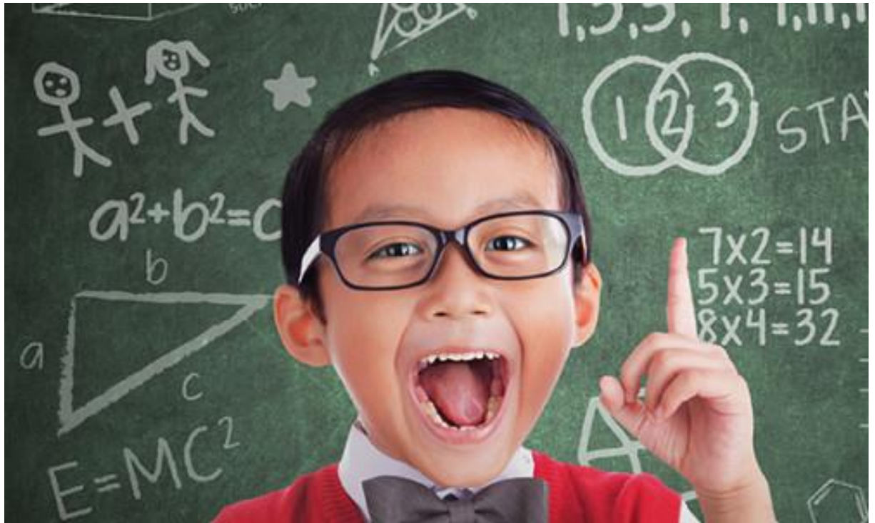
3 Image 1 : représente le comportement d'un sujet motivé.

D'après les lectures et les directions qu'on a consultées pour collecter les données sur notre thème, le concept de la motivation n'a pas été réellement développé qu'à partir de la deuxième partie du XXème siècle, nous disposons aujourd'hui d'une multitude de théories et de courants de pensées sur ce thème, courants et théories que nous allons présenter ici de manière très synthétique afin de bénéficier d'une vue d'ensemble de la motivation. Nous devons bien sûr en premier lieu donner une définition du concept de motivation afin de bénéficier d'un cadre commun de réflexion. La définition courante de la motivation consiste à la décrire comme étant «le construit hypothétique utilisé afin de décrire les forces internes et externes produisant le déclenchement, la direction, l'intensité et la persistance du comportement» 4