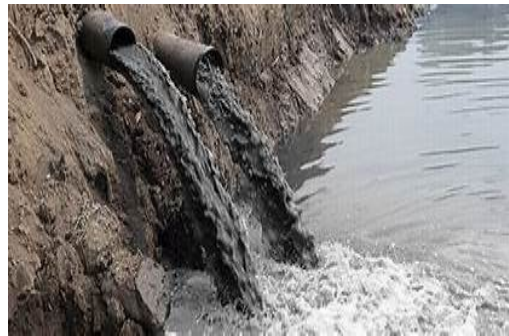
Figure 2 : La pollution de l'eau