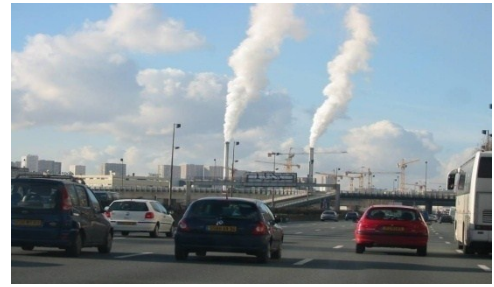
Figure 1 : La pollution de l'air