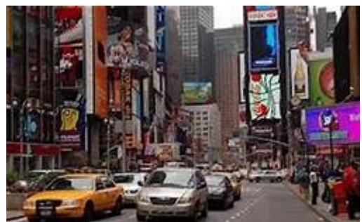
Figure 4: La pollution visuelle et sonore