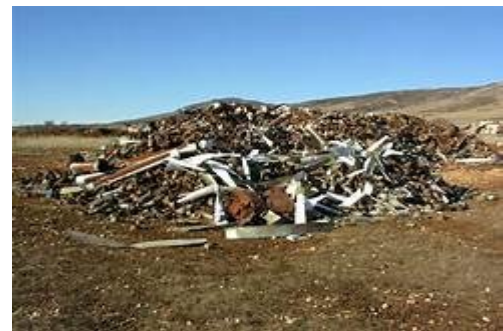
Figure 3: La pollution du sol