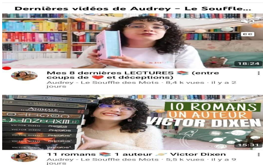
Figure 1 : Présentation du book tube