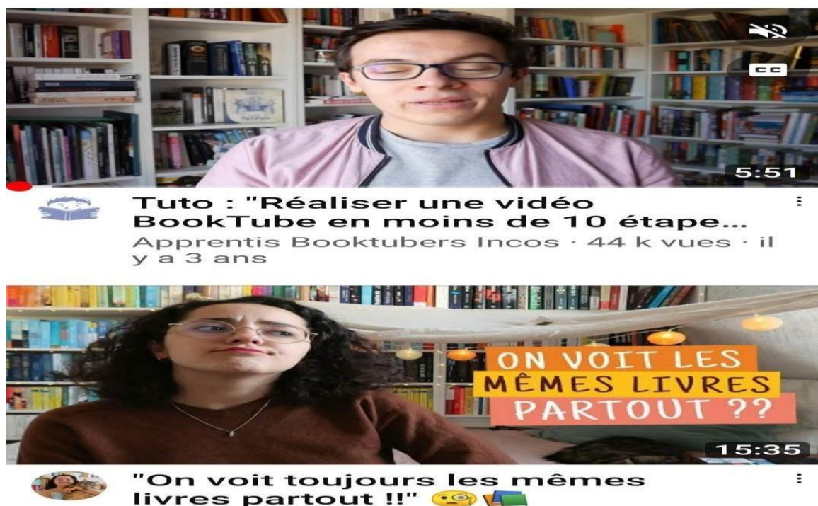
Figure 3 : Réalise une vidéo Book tube